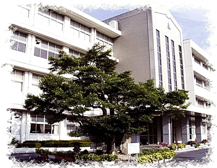
徳山高校 おがたまの木