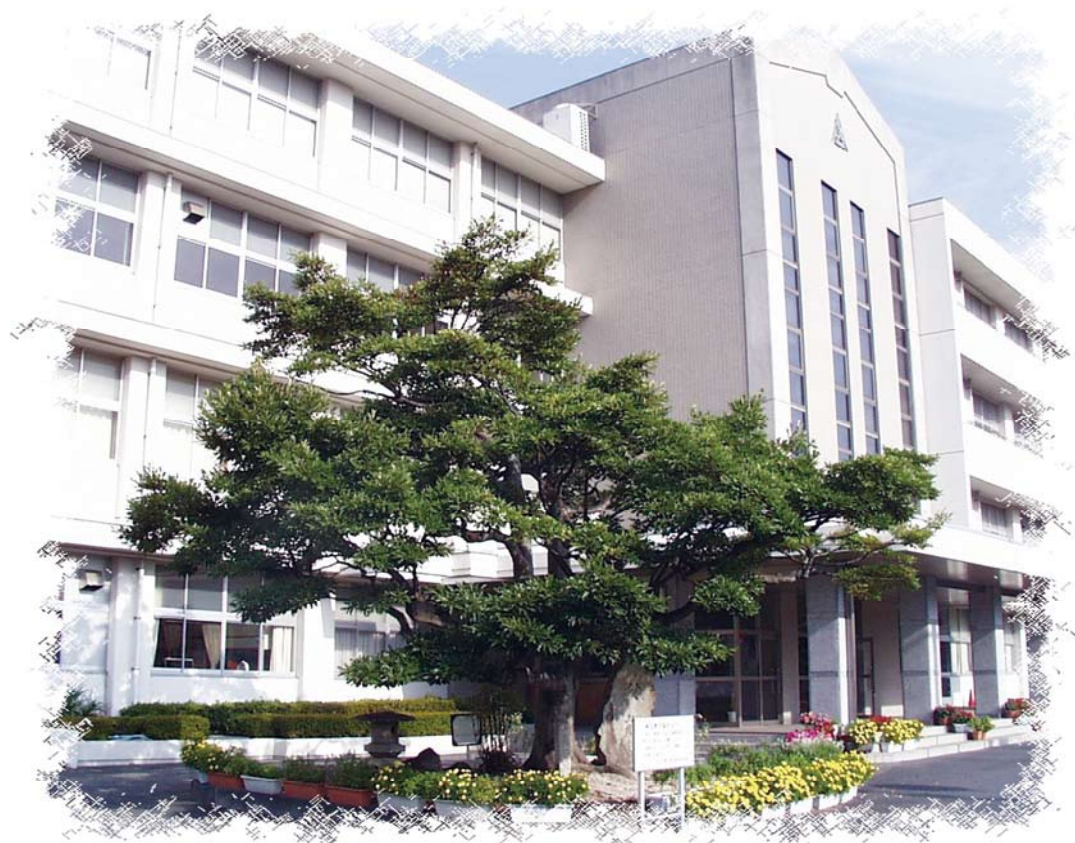
徳山高校 おがたまの木