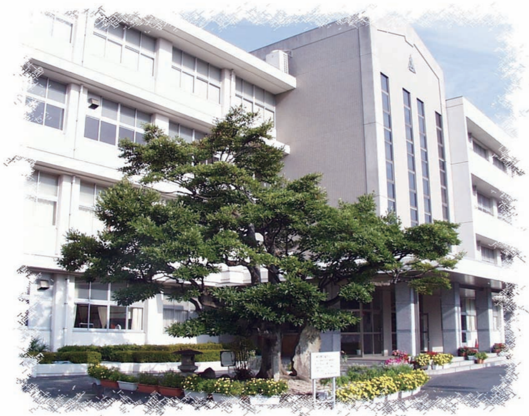
徳山高校 おがたまの木