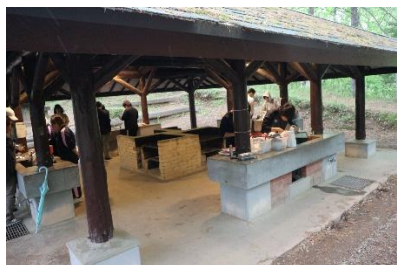
新入生歓迎遠足(5月)

令和7年度は、徳地青少年自然の家に行きました。バーベキューをしたり、レクリエーションをしたりして親交を深めました。