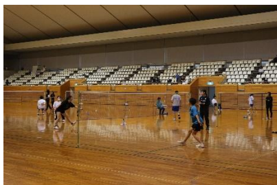
定時制通信制体育大会(6月・10月)

日頃の部活動でがんばった成果を出す場です。令和7年度もバドミントン部の生徒が全国大会に出場しました。