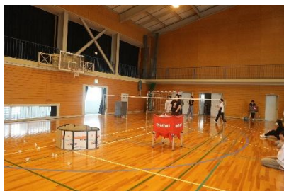
クラスマッチ(各学期)

1学期のクラスマッチは生徒会の企画した競技を、全学年で2チームに分かれて実施しました。