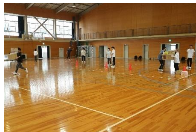
クラスマッチ(各学期)

1学期のクラスマッチは生徒会の企画した競技を、全学年で4チームに分かれて実施しました。