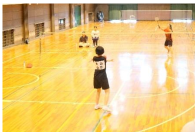
定時制通信制体育大会(6月・10月)

日頃の部活動でがんばった成果を出す場です。令和6年度もバドミントン部と陸上部の生徒が全国大会に出場しました。