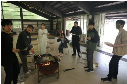
新入生歓迎遠足(5月)

令和6年度は、徳地青少年自然の家に行きました。バーベキューをしたり、レクリエーションをしたりして親交を深めました。