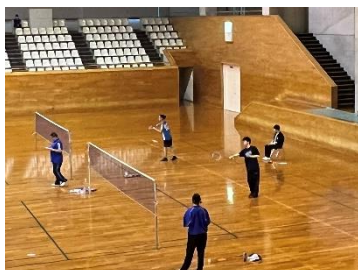
定時制通信制体育大会(6月・10月)

日ごろの部活動でがんばった成果を出す場です。令和5年度も、バドミントン部の生徒が全国大会に出場しました。