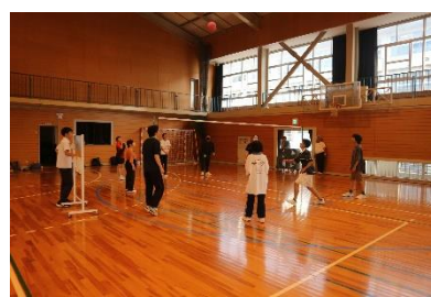
クラスマッチ(各学期)

1学期のクラスマッチはソフトタッチバレーとフリスビードッジを、全学年で4チームに分かれて実施しました。