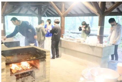
新入生歓迎遠足(5月)

令和5年度は、徳地青少年自然の家に行きました。バーベキューをしたり、ニューススポーツをしたりして親交を深めました。