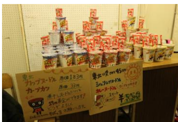
被災地から取り寄せた商品