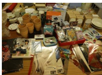
他にもさまざまな商品が...