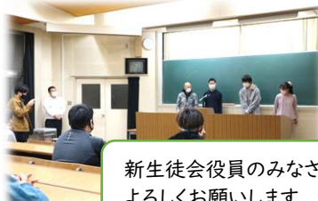
新生徒会役員のみなさん、よろしくお願いします

生徒会選挙を終え、生徒総会で新旧生徒会役員が挨拶を行いました。前生徒会長、前総務委員長から、振り返りや新生徒会への思いが伝えられました。また、5名のうち3名が引き続き役員を担うことになり、新生徒会長を支えていくことと期待します。