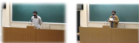
生徒会長、総務委員長お疲れさまでした